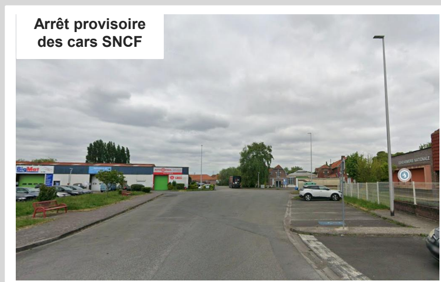
Arrêt provisoire des cars SNCF