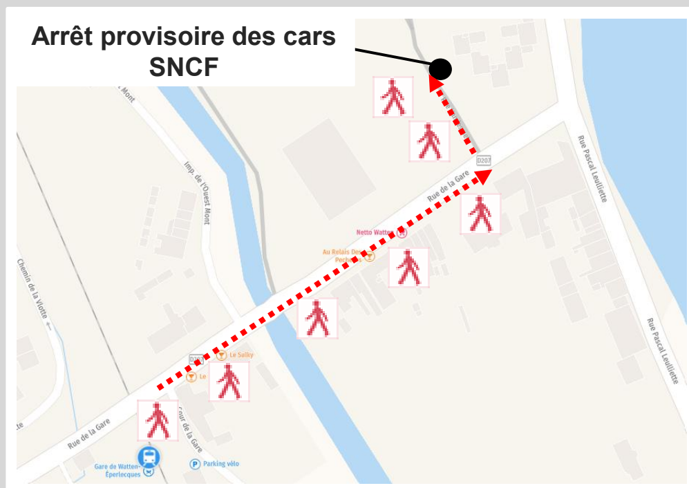
Arrêt provisoire des cars SNCF

4 minutes à pied depuis la gare SNCF (290m)