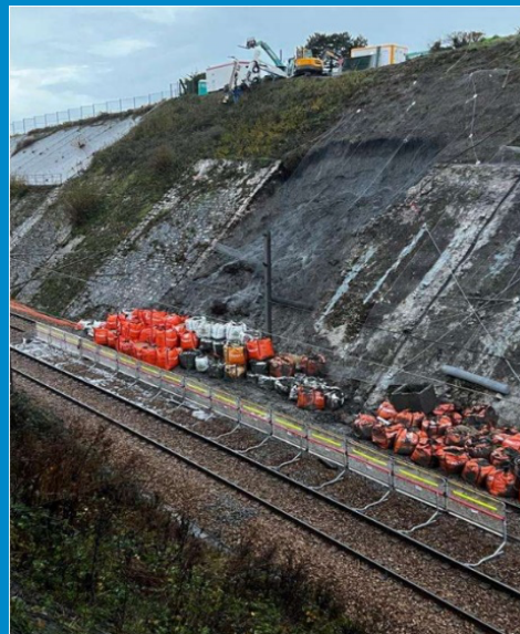
SOURCE COMMUNIQUE DE PRESSE SNCF RÉSEAU HAUTS-DE-FRANCE Lille le 5 décembre 2022.

L'avancement des travaux communiqué par SNCF Réseau donne comme objectif une reprise de la circulation ferroviaire au plus tôt fin janvier, dans un premier temps à vitesse réduite puis, à vitesse normale à une date encore non précisée.