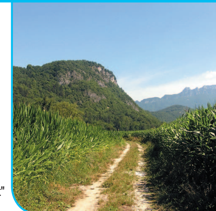
La plaine du Rhône et la butte St-Romain

IGN : TOP25 3332 OT "Chambéry-lac du Bourget"