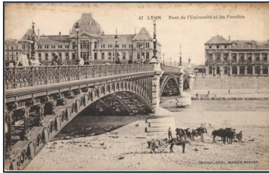
Pont de l'Université et des Facultés

SAVEZ-VOUS QUE : Au printemps 1914, est mis en service le premier bateau de tourisme sur le Rhône, baptisé le Ville de Lyon, destiné à faire découvrir les charmes de la vallée du Rhône.