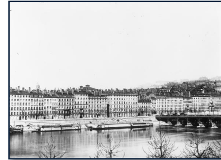
L'ancien pont Morand et les bains Marmet sur le Rhône, ca. 1880

BON PLAN : pour tout savoir sur les Ponts de Lyon et la région, téléchargez l'Appli Les ponts du Rhône Service Régional de l'inventaire . smartphones Apple et Android.