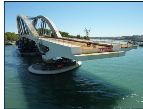
Pont Raymond Barre

SAVEZ VOUS QUE : Le Pont Raymond Barre est réservé aux modes doux. Lors de son installation, il fut acheminé sur des barges.